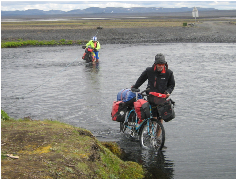
Unsere letzte Furt an der Lindaá

Endlich kommen wir an unsere definitiv allerletzte Furt. Wir müssen die Lindaá durchqueren. Hier ist sogar ein Seil gespannt, damit man dir richtige Stelle besser findet. Das ist wohl mehr für Leute gedacht, die von Norden kommen. Für die ist das dann die erste Furt. Oder soll das Seil zum Festhalten sein, wenn mal eine starke Strömung herrscht? Bei dem bischen Wasser kann man sich das nicht vorstellen. Etwas Wehmut ist schon dabei, als ich hindurch schiebe, die Furten waren immer irgendwie das Salz in der Suppe auf unserer Tour.