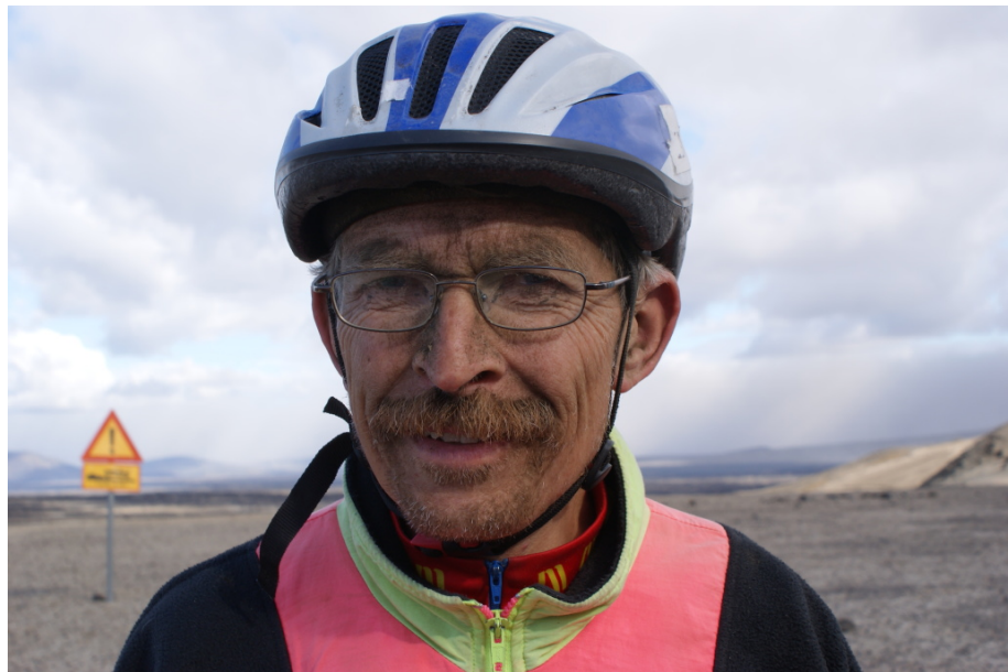
Gezeichnet von den Strapazen des Tages

In unseren Gesichtern kann man noch die Spuren des Sandsturms erkennen. Der feine schwarze Sand haftet gut auf der verschwitzten Haut. Wir freuen uns auf eine warme Dusche, denn die soll es hier geben. Zunächst müssen aber erst die Zelte aufgebaut werden. Da der Sturm immer noch recht heftig zugeht, ist das kein leichtes Unterfangen.