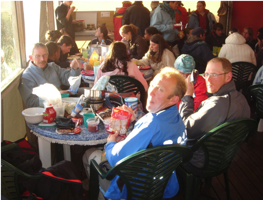
Viele Menschen im Frühstücksraum

Im Grunde ist unsere Fahrt jetzt zuende. Allerdings erleben wir doch noch ein paar Dinge, die erwähnenswert sind.