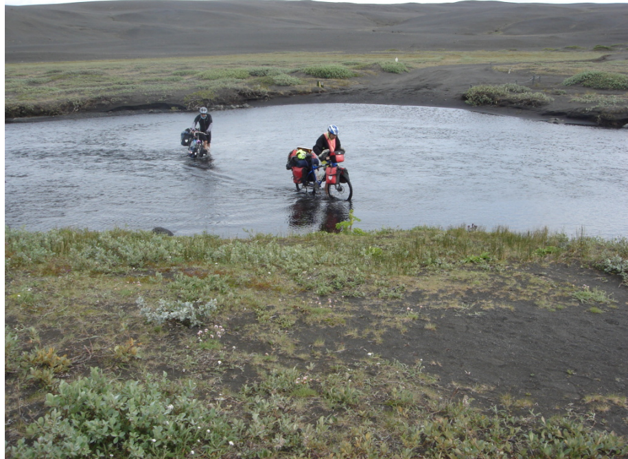
Noch eine kleine Furt

Schon bald zeigt sich wieder eine Furt. Auch diese ist recht harmlos. Die Ideallinie führt in einem leichten Bogen nach links. Es ist auch hier nicht notwendig, einen spitzen Winkel gegen die Strömung einzuhalten. Man geht einfach entlang der flachsten Strecke hindurch. Wir können mittlerweile alle an der Wasseroberfläche erkennen, wo sich diese befindet. Diese Erfahrungen haben wir in der letzten Woche gut sammeln können.