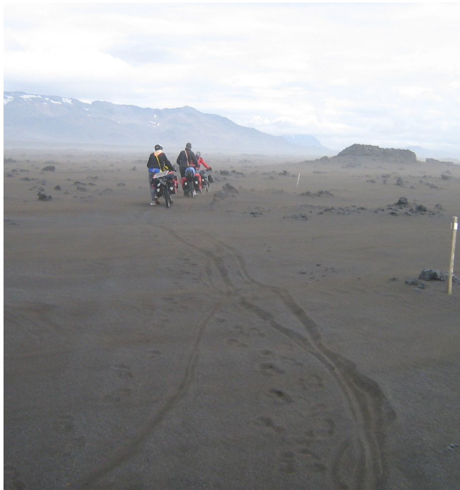
Im tiefen Wüstensand kann man nur schieben

Wie so oft im Leben kommt es auch beim Schieben auf die richtige Technik an. Zunächst schrauben wir das linke Pedal ab, um unnötige Verletzungen am rechten Bein zu vermeiden. Dann wird ein Gurt über die linke Schulter und das hintere Ende des Sattels gelegt. Das bewirkt eine Entlastung des Hinterrades, wenn man den Körper zum Schieben nach vorne stemmt. Dadurch sinkt es nicht ganz so tief ein und das Schieben geht etwas leichter. „Leichter“ ist natürlich sehr relativ, in der Praxis geht das Schieben immer noch ver-