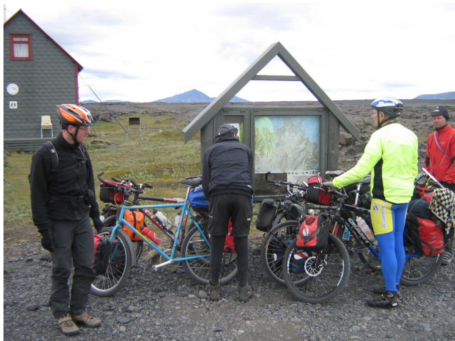
Kekspause am Campingplatz Herðubreiðarlindir

Die nächste Kekspause findet dann in Herðubreiðarlindir nach etwa 40 Tageskilometern statt. Hier ist auch ein Campingplatz, aber wir wollen heute noch weiter bis zu dem Campingplatz Grímsstaðir. Wir setzten uns in den Windschatten des Hauses, das dort steht, denn der Wind bläst immer noch recht heftig. Deswegen halten wir uns auch nicht übermäßig lange auf, sondern fahren bald weiter. Wir haben heute noch über 60 Kilometer vor uns.