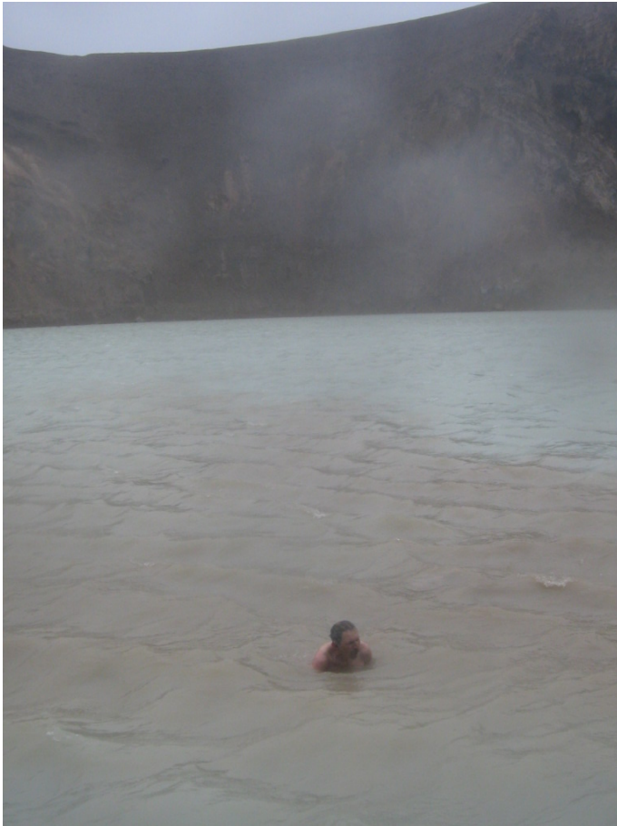
Baden im Vití – herrlich warm!

Für diese Strapazen entschädigt dann allerdings das Bad im Vití. Problematisch ist natürlich, dass ich mich vorher bei einer Luft-Temperatur um die 8 Grad und bei heftigem Wind ausziehen muss. Das Schwimmen im 32°C warmen Vití ist dagegen ein Genuss. Leider kann ich keine Schwimmzüge machen, die Prellung im Brustbereich vom Sturz vorgestern lässt dies noch nicht zu. Aber planschen ist ja auch ganz nett. Man kann auch die Füße in den schlammigen Boden stecken – da ist es noch wärmer. Diese natürliche See-Heizung ist schon irgendwie faszinierend!