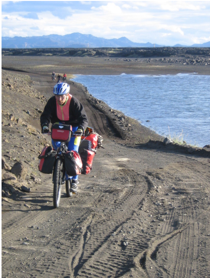
Der Untergrund ist sehr staubig

Die Piste ist insgesamt etwas wellig. Es geht also immer wieder ein Stück rauf und auch wieder runter. Wirklich lange Anstiege sind aber keine dabei. Man kommt halt nur nicht so schnell vorwärts, wie man sich das vielleicht wünschen könnte.