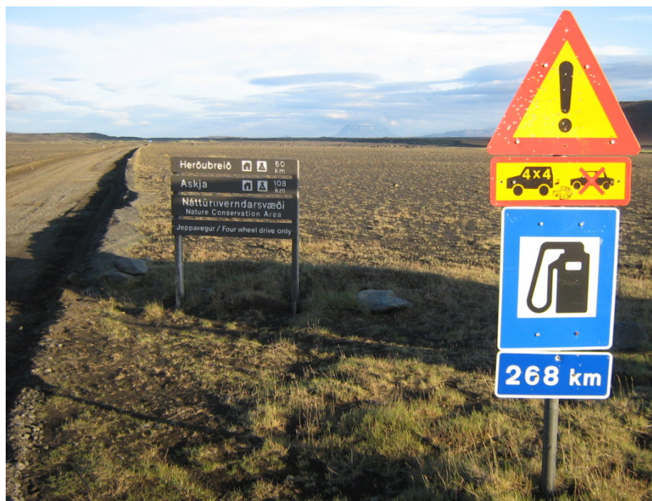
Das Ende der Piste 20 – von dort hinten sind wir gekommen

Irgendwann gegen Abend erreichen wir aber doch noch das Ende der Piste. Damit sind wir heute bereits über 100 km Jeeptrack gefahren. Jetzt müssen wir nur noch etwa 5 km über Asphalt bis zum Ziel des Tages – dem Campingplatz Grímsstaðir.