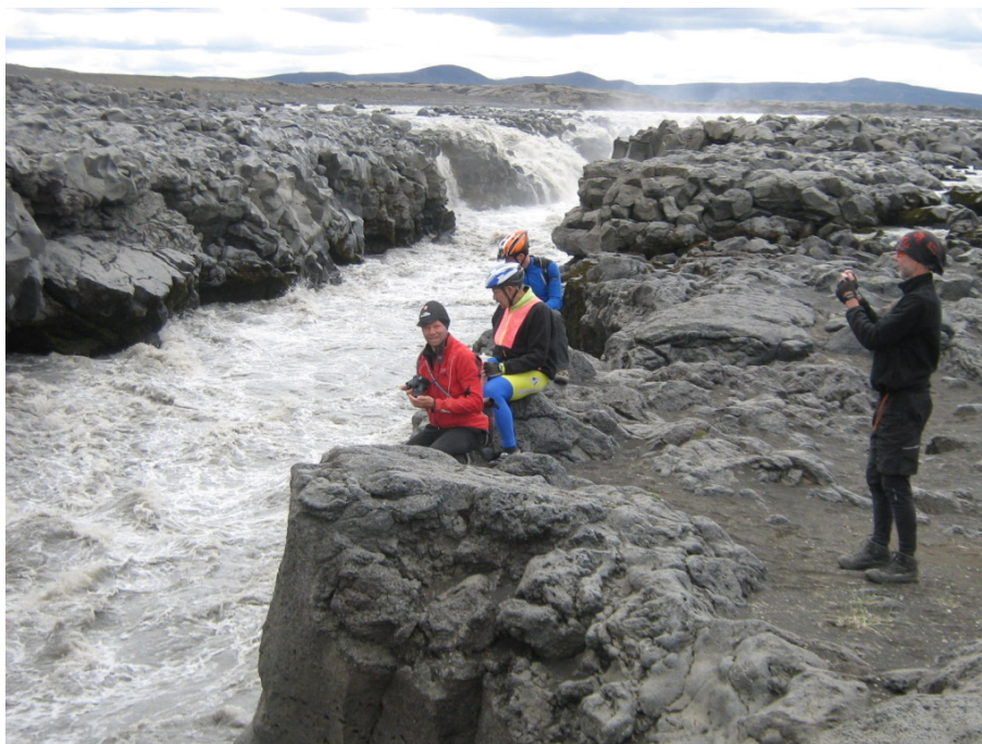
Am Jökulsá á Fjöllum, im Hintergrund Wasserfälle

Nach ein paar Stunden kommen wir am Jökulsá á Fjöllum vorbei. Hier lohnt es sich, eine Pause zu machen. Gewaltige Wassermassen brausen hier durch, der Fluss hat sich tief in die Felslandschaft eingeschnitten. Es macht Mühe, sich zu unterhalten, so laut ist das Getöse. Hier wäre es völlig unmöglich, den Fluss zu durchqueren. Glücklicherweise müssen wir das auch nicht, wir dürfen weiter links am Fluss entlang fahren.