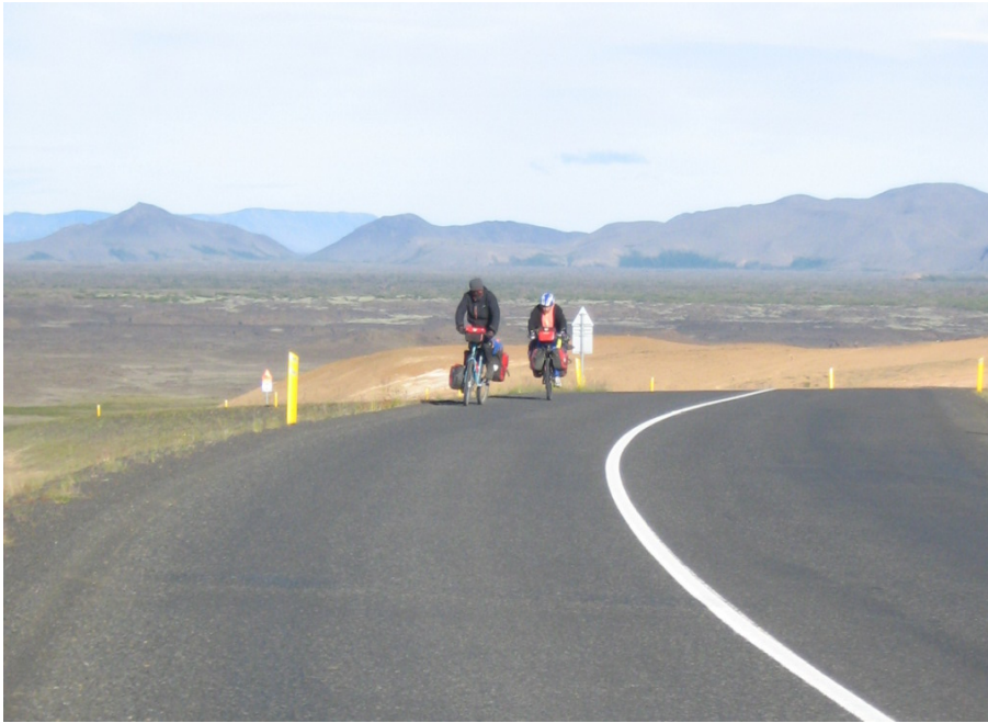
Noch über einen Berg, dann sind wir am Mývatn

Nachdem wir uns die heißen Quellen ausreichend lange angesehen haben, fahren wir weiter. Wir müssen nur noch über einen einzigen Berg, dann sind wir am Endpunkt unserer Reise, am Mývatn. Für diese letzten paar Kilometer brauchen wir auch nicht lange.