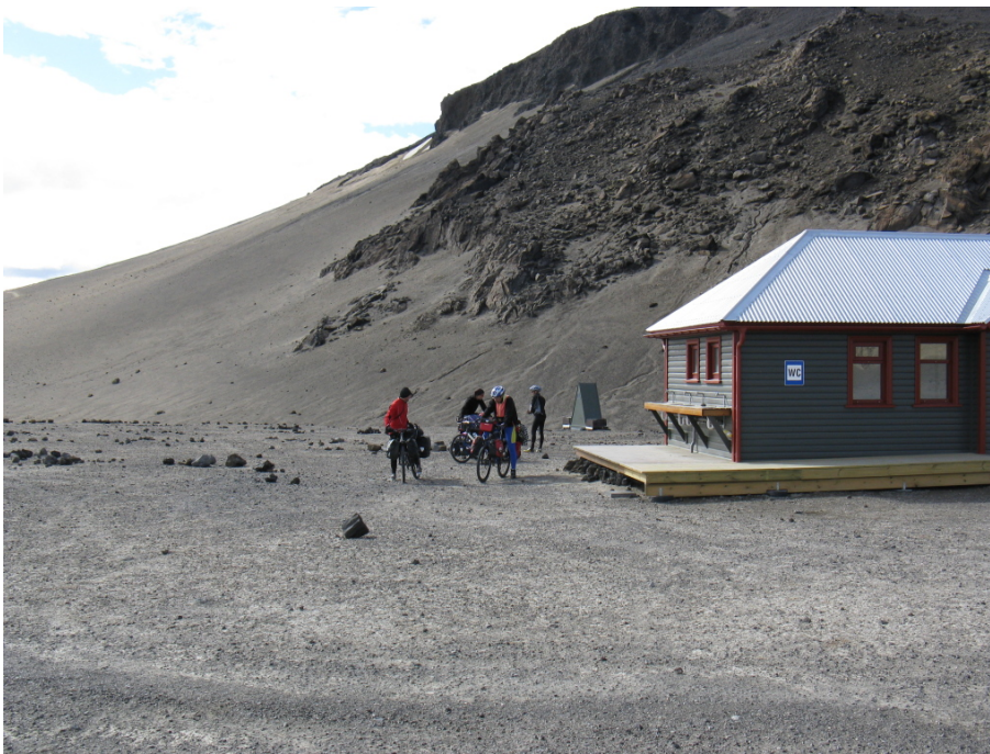
Wir wollen jetzt aufbrechen

Schon beim Wachwerden stellen wir fest, dass sich das Wetter grundlegend gewandelt hat. Es ist zwar noch etwas bewölkt, aber es ist trocken, wenn auch nicht sehr warm. Wir wollen heute bis fast an die Nordküste Islands fahren, zum Campingplatz Grímsstaðir. Das ist ein weiter Weg.