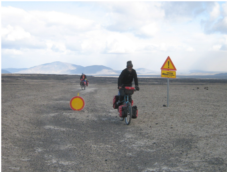
Wir haben es geschafft!

Gegen 17:30 Uhr erreichen wir den Campingplatz nach einer „Fahrtstrecke“ von insgesamt 39 km. Das hört sich nicht nach einer langen Strecke an, aber sie war ganz sicher der anstrengendste Abschnitt unserer bisherigen Tour. Von dieser Seite ist die Strecke noch mit einem entsprechenden Schild gesperrt. Wir haben aber gezeigt, dass man sie dennoch bewältigen kann. Wir sind glücklich und stolz, dass wir