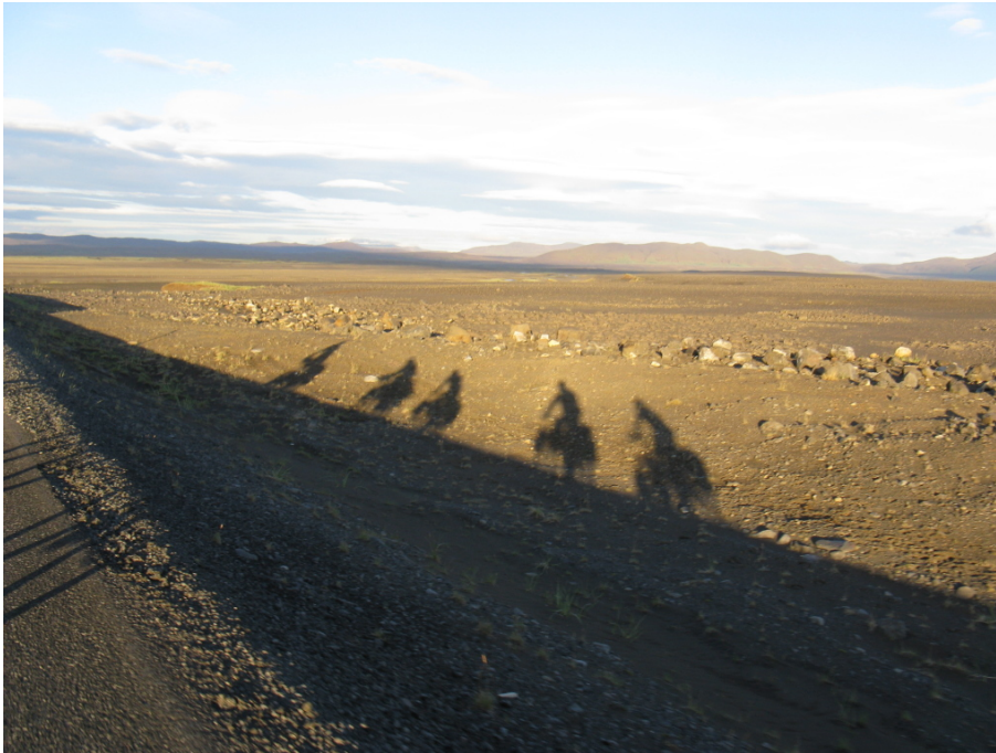
Die letzten Kilometer zum Campingplatz

Die Sonne steht schon tief am Himmel. Unsere Schatten werden immer länger. Nach insgesamt 113 km – fast ausschließlich über Pisten – erreichen wir schließlich gegen 22:00 Uhr den Campingplatz in Grímsstaðir. Das war heute eine sehr weite und lange Fahrt.