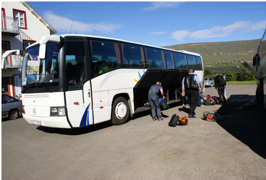
Umladen des Gepäcks in Akureyri in anderen Bus

Am Nachmittag besteigen wir den Bus, der uns zunächst nach Akureyri bringt. Ziemlich lange dauert der Beladevorgang mit unserem Gepäck, denn es müssen nicht nur alle Packtaschen, das Solarpanel und allerlei Kleinteile wie Gummigurte, Helme, Lenkertaschen, Antennenstäbe usw. in den Bauch des Busses eingeladen werden, die Räder müssen auch teil-