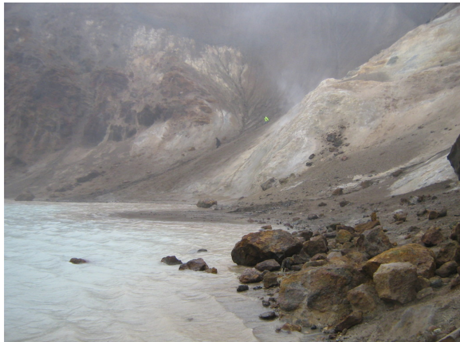
Durch den Schlamm bergab zum Viti

Aus meiner Sicht ist der Abstieg zum Kratersee die absolute Härte, denn ich bin kein Bergsteiger. Man stellt sich oben auf die Schräge am Hang und schon gleitet man auf dem Schlamm mehr oder weniger schnell den Hang hinunter. Für mich ist das irgendwie unkontrollierbar. Und es geht mir durch den Kopf: „Wie soll ich da bloß wieder hinaufkommen?“