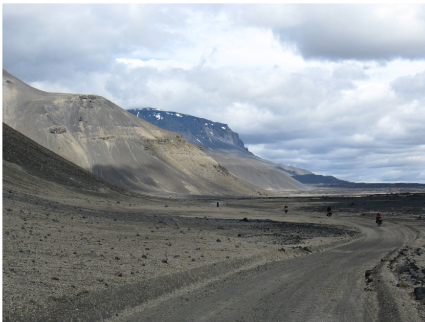
In der bizarren Landschaft

Meine Schuhe sind noch quatschnass von der gestrigen Reinigung. Daher muss ich wieder die Klickschuhe anziehen. Die Schuhe und auch das nasse Handtuch habe ich außerhalb der Packtaschen auf dem Gepäckträger befestigt, damit alles trocknen kann.