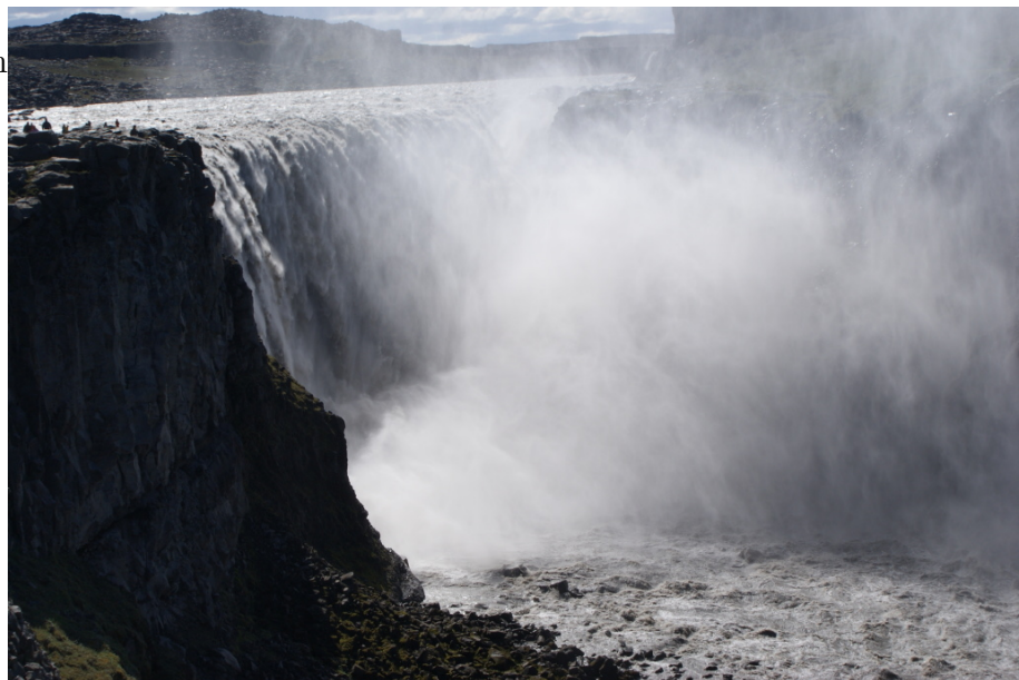
Der Dettivoss am Jökulsá á Fjöllum