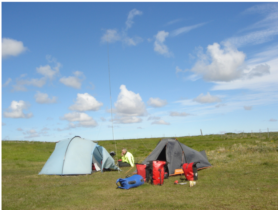
Die Stab-Antenne ist 6m lang

Nach dem gemein- samen Frühstück baue ich meine An- tenne und die an- deren Gerätschaften auf. Das Funkgerät liegt auf einer Plas- tikfolie als Unterla- ge, der Akkublock mit den provisio- rischen Anschluss- klemmen daneben. Das Solarpanel ist an das Rad ange- lehnt, damit es die volle Sonnen- bestrahlung mitbe- kommt.