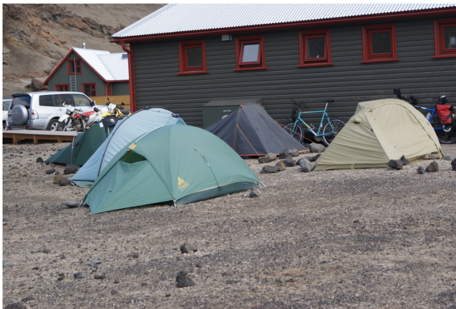
Die Heringe sind mit dicken Steinen gesichert

Zelte allerdings im Windschatten des Sanitärgebäudes aufgebaut.