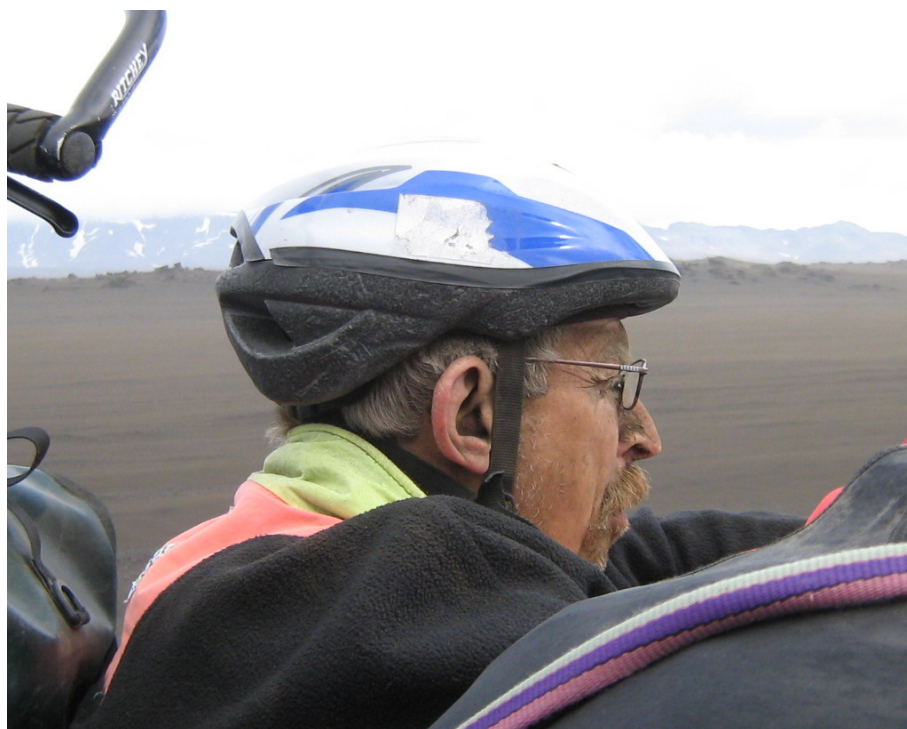
Die erste Rast – sehe ich etwa geschafft aus?

Nach einiger Zeit erreichen wir endlich das Ende des Schwemmsandfeldes. Wir haben es geschafft – glauben wir. Aber der Tag ist lange noch nicht vorbei. Jetzt erwartet uns nämlich ein richtiger Sandsturm. Was wir vorher im Schwemmsandfeld erlebten, war vergleichsweise Kinderkram. Man kann jetzt nur noch mit Mühe die Augen einen kleinen Spalt offen halten, obwohl doch der Sandsturm von hinten kommt. Wie