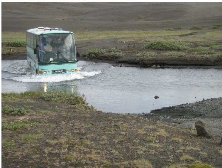
Ein Reisebus durchquert die Furt