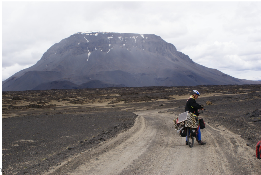
Der 770 Meter hohe Dreki

Der 770 Meter hohe Dreki soll dadurch entstanden sein, dass unter einer mehreren Hundert Meter dicken Eisschicht ein Vulkan ausgebrochen ist. Als dann die Spitze des Auswurfs oben aus dem Eis herausschaute, bildete sich diese sonderbare Mütze des Dreki. Dort kam die Lava besser durch, am Rand kühlte sie das Eis.