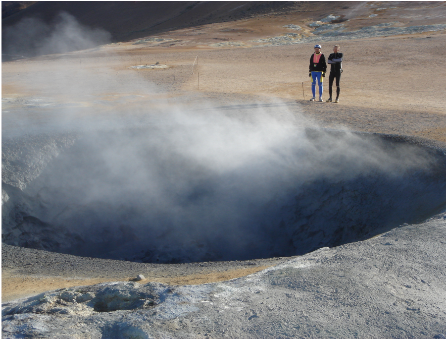
Die heißen Quellen von Námarskarð

wir natürlich besuchen. Für diese Art von Sehenswürdigkeiten sind wir ja schließlich auf Island.