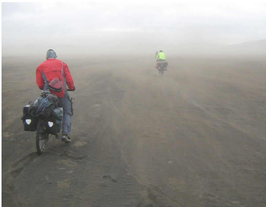
Immer wieder bleibt man im Staub stecken

Wenn die sich zusätzlich noch mit Sand füllen, dann sind Blasen an den Füßen garantiert.