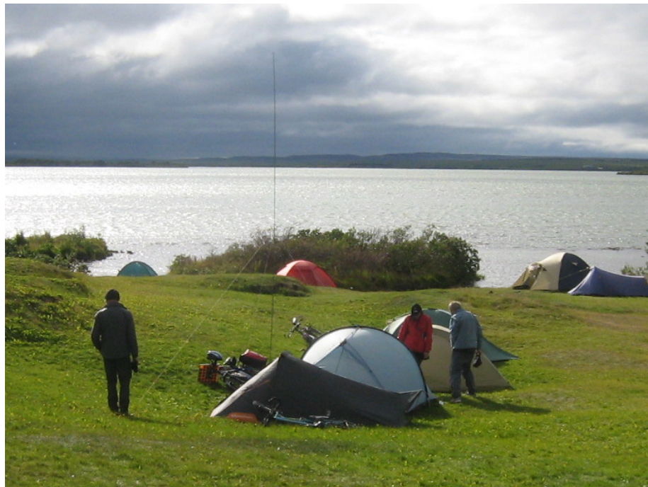
Unsere Zelte am Mývatn

Man kann die vielen Zelte kaum zählen, die da alle stehen. Gleich um die Ecke gibt es auch einen Supermarkt, in dem man alles kaufen kann, was das Herz begehrt. Allerdings nicht mehr heute, denn es ist schon kurz nach 20:00 Uhr, als wir ankommen. Eine Besonderheit gibt es noch auf der Toilette des Campingplatzes. Die Klospülung arbeitet hier nämlich mit heißem Wasser. Vermutlich