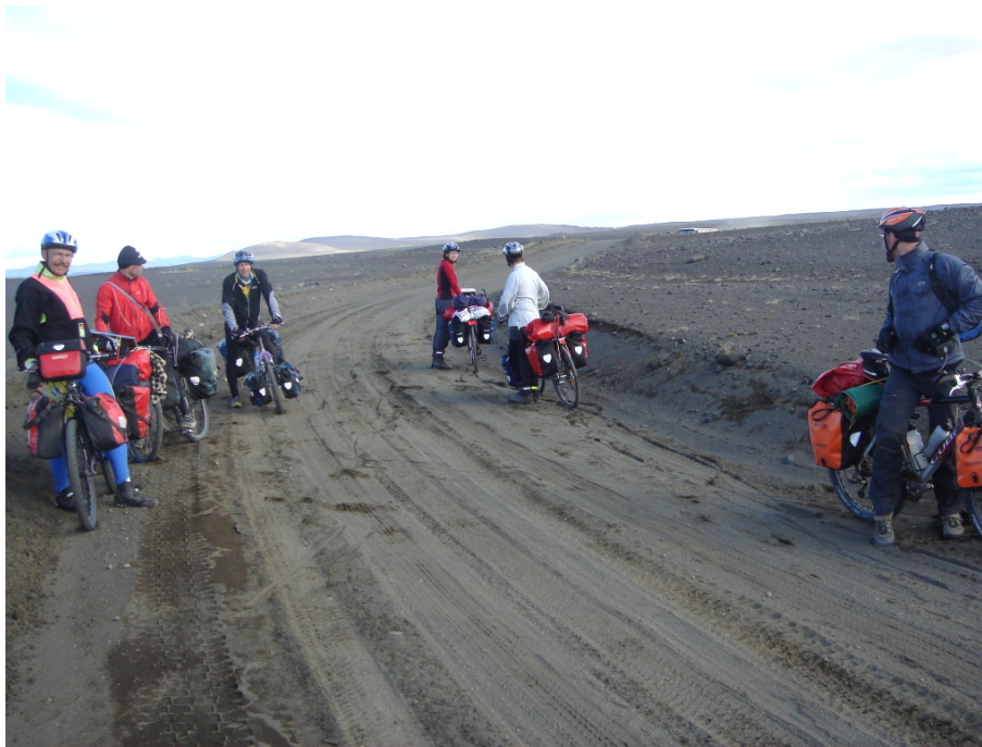
Die Räder der jungen Leute haben schmale Reifen

Am späten Nachmittag begegnet uns ein junges Paar aus Ostdeutschland. Die beiden beklagen sich, dass die Piste sehr schwer zu befahren sei, sie bleiben ständig irgendwo stecken. Wir beruhigen sie zunächst, dass der Wegteil, der noch vor ihnen liegt, offenbar leichter zu befahren ist. Dann sehen wir aber, dass die beiden vermutlich deshalb größere Probleme als wir haben, weil sie mit