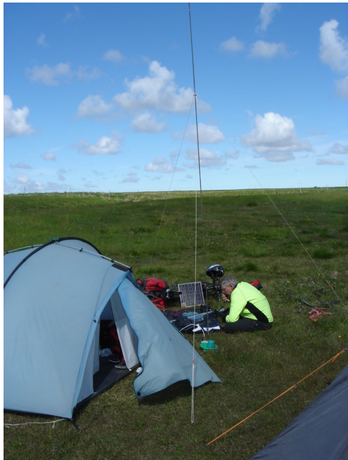
Es geht bis nach Deutschland