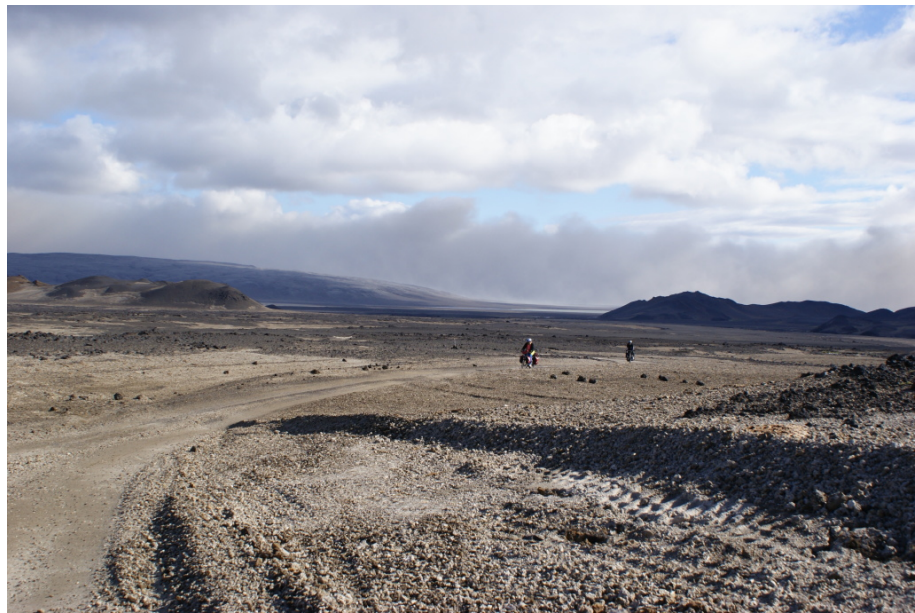
Auf dem gelben Bims kann man wieder fahren

Flugs werden die Pedale wieder angeschraubt, wir versuchen, zu fahren. Wie schon gesagt, im Prinzip geht das auch, in der Praxis müssen wir anfangs aber immer noch alle paar Meter absteigen und ein Stück schieben. Nach und nach wird der Untergrund aber besser und längere Fahrpassagen sind möglich. Es wird schließlich zu einer „ganz normalen“ Buckelpiste mit den üblichen groben Steinen und Staublöchern.