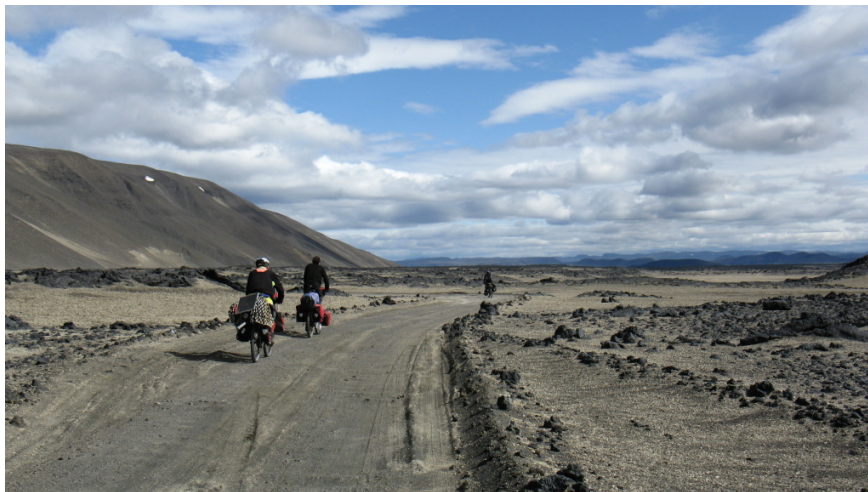
Wir fahren über eine relativ gut befahrbare Piste