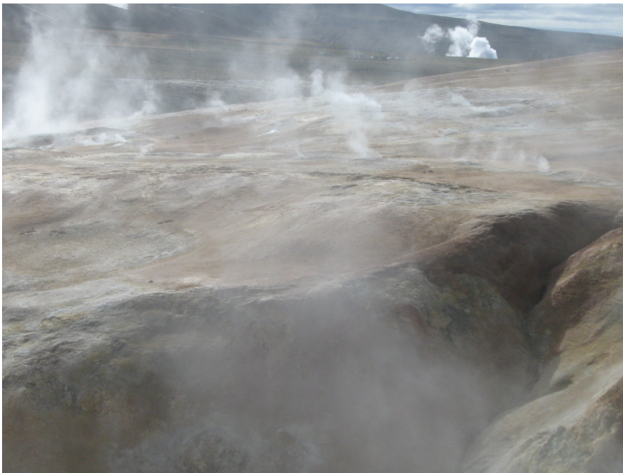
Überall dampft es aus dem Boden

Wir wandern anschließend zurück zum Campingplatz. Auf diesem Weg kommen wir zunächst durch ein Feld mit unendlich vielen heißen Quellen. Überall steigt Dampf auf, der Boden ist voller gelblichem Schwefel. Irgendwie können mich diese Felder immer wieder faszinieren. Nicht zu beschreiben ist der Geruch, der sich damit verbindet.