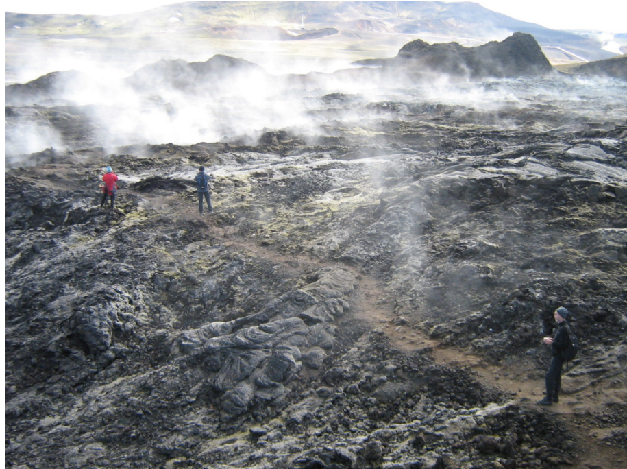
Wanderung durch das frische Lavafeld

Danach führt uns der Weg über ein relativ frisches Lavafeld. Die zugehörigen Vulkanausbrüche der Krafla sind erst wenige Jahre her. Die fanden in den Jahren 1980 bis 1986 statt. Daher ist die Lava besonders schwarz und aus allen Ritzen und Fugen dampft es aus dem Boden. Legt man irgendwo die Hand auf den Boden, ist es warm oder sogar heiß. Man stellt sich besser nicht vor, wie es hier einen halben Meter unter der Oberfläche aussieht. Sonst beschleichen einen sonderbare Gefühle.