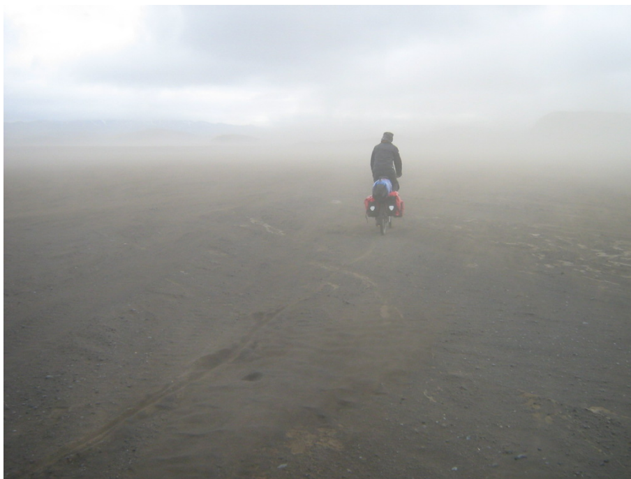
Berge über dem Staub am Horizont

Noch eine ganze Weile sind wir auf dem Schwemmsandfeld unterwegs. Der Blick zum Horizont ist durch den aufgewirbelten Staub verdeckt. Knapp darüber sind aber die Konturen der umliegenden Berge sichtbar. Das sieht schon sehr beeindruckend aus. Obwohl wir auf unserer Tour schon so viel gesehen haben, zeigt uns die Natur offenbar immer wieder neue aufregende Bilder.