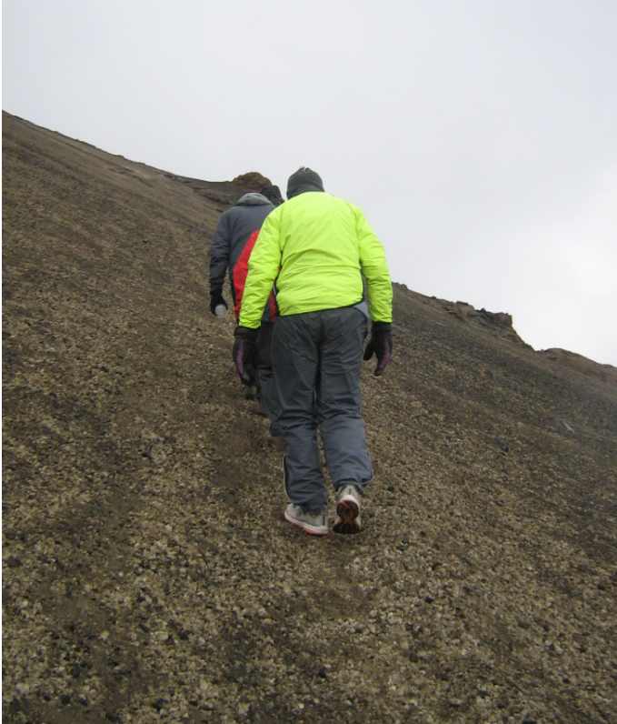
Wir wandern zum Viti

Als wir nach einem sehr langen ausgiebigen Frühstück endlich zu unserer Wanderung aufbrechen, regnet es noch immer, wenn auch nicht sehr heftig. Zum Viti gibt es zwei Wege. Wir können über eine Straße dort hinkommen, wir können auch einen Wanderweg wählen. Wir entscheiden uns für den Wanderweg, weil das vermutlich die landschaftlich schönere Strecke ist. Allerdings erweist sich der 8 km lange Weg als sehr steil und teilweise recht schlammig. Wieder sind Schuhe und Strümpfe nass, diesmal sogar voller Schlamm. Dabei war ich froh, dass die Schuhe über Nacht endlich wieder trocken geworden waren. Ich hatte sie im Aufenthaltsraum trocknen lassen.