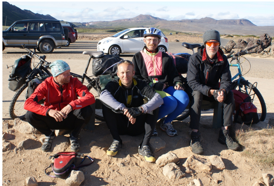
Ein Gruppenbild bei Námarskarð

Als wir uns zu einer Kekspause hingesetzt haben, kommen drei isländische junge Mädchen vorbei und fotografieren sich gegenseitig. Als sie uns sehen, wollen sie auch ein Gruppenbild mit uns machen. Sehen wir irgendwie besonders aus? Jedenfalls fotografieren sie uns anschließend auf unsere Bitte hin auch mit einem unserer Fotoapparate.