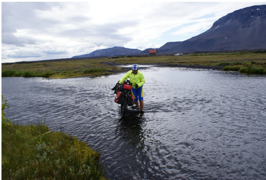
Eine kleine harmlose Furt

Schon wenige Meter hinter dem Campingplatz Herðubreiðarlindir stellt sich uns wieder eine kleine Furt in den Weg. Sie ist jedoch wirklich harmlos, auch wenn sie nicht direkt zu durchfahren ist. Es ist nicht einmal notwendig, die Hosenbeine ganz hoch zu krepeln.