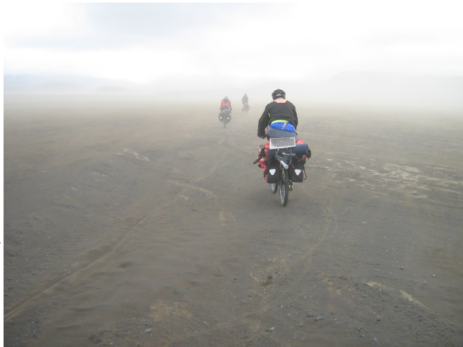
Keine Wegmarkierungen im Sandsturm sichtbar

Ein anderes Problem empfinde ich allerdings als noch dramatischer, als den Zeitdruck bei der Flucht. Im Sandsturm wird – wie der Name schon sagt – ziemlich viel Sand aufgewirbelt. Wir haben zwar insofern Glück, als dass der Sturm ziemlich genau von hinten kommt, aber trotzdem ist die Sicht recht schlecht. Es ist keinesfalls möglich, von einer Wegmarkierung bis zur nächsten zu sehen.