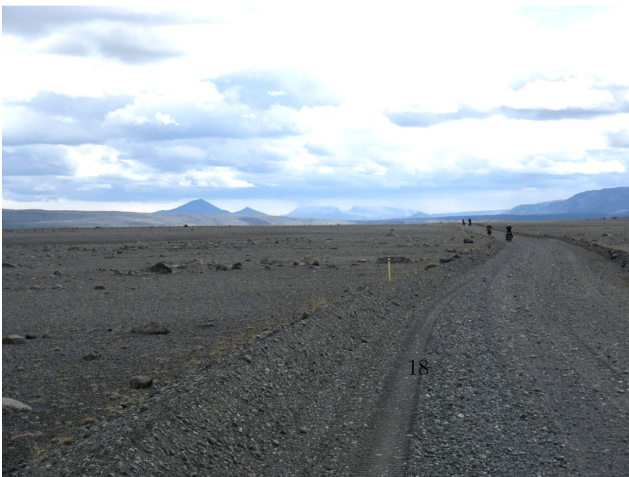
Der Untergrund ist loser Schotter

Der Untergrund, über den wir fahren, verändert sich immer wieder. Zeitweilig besteht er aus einer dicken Schicht aus losem Schotter, in die die Reifen tief einsinken. Dann ist kräftiges Treten angesagt, denn die Schotterschicht bremst schon ganz ordentlich. Vorteil-