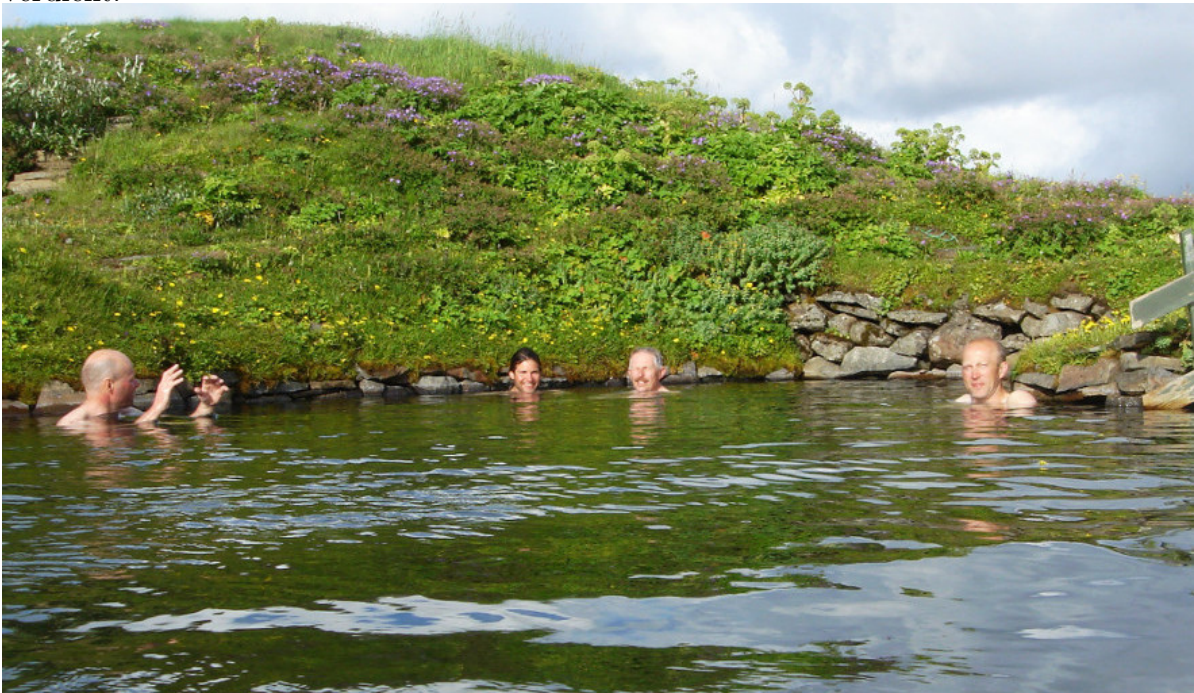
Im heißen Badeteich am Campingplatz Laugafell

Nachdem dann die Zelte aufgebaut sind, sitzen wir alle eine Stunde im warmen Badeteich und genießen das Leben. Herrlich! Wir bestätigen uns gegenseitig: Das haben wir uns verdient!