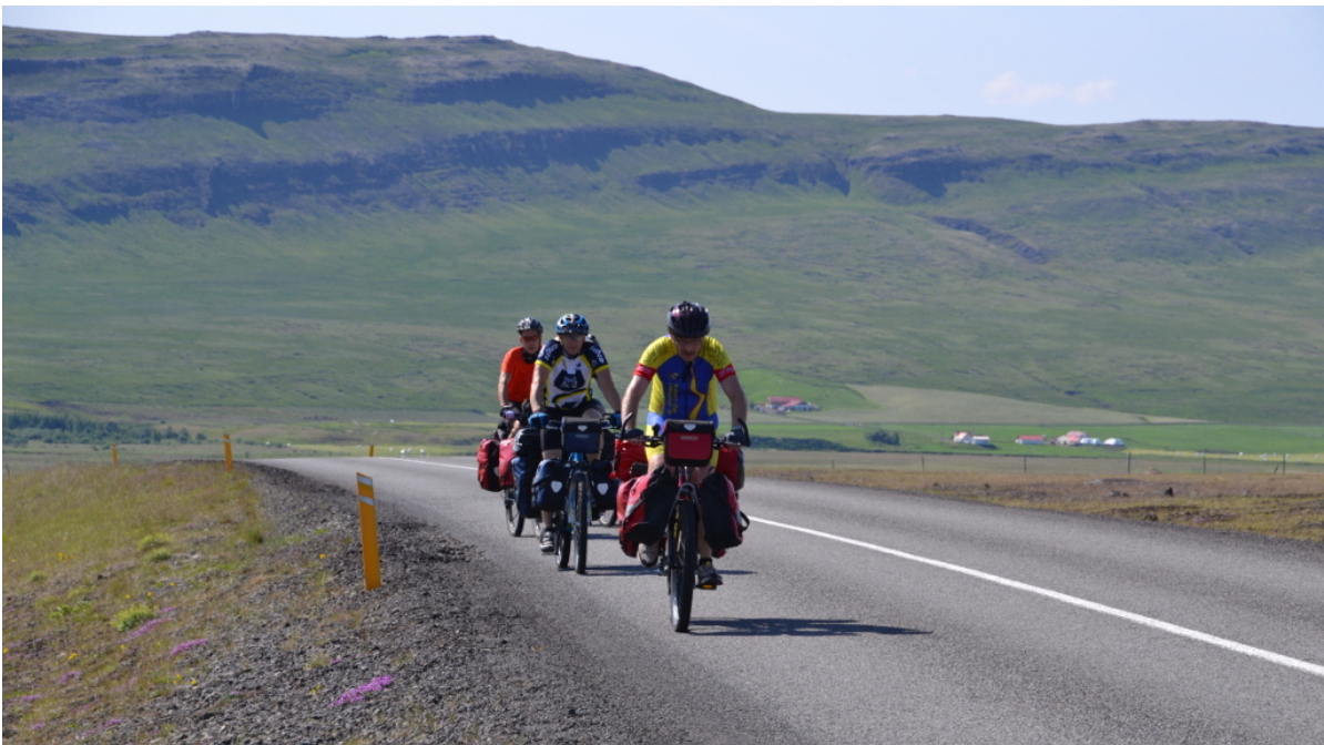
Zunächst geht es über Asphalt

Dienstag, der 23. Juli Die Sonne scheint, es ist angenehm warm. Tiefhängende Wolken in den Bergen lösen sich langsam auf. Bis 22 Grad geht das Thermometer im Laufe des Tages hoch. Vor der Abfahrt gegen 10 Uhr am Morgen habe ich noch schnell mein verschwitztes Rad-Trikot gewaschen. Beim Anziehen ist es natürlich noch nicht ganz trocken, daher kühlt es recht angenehm.