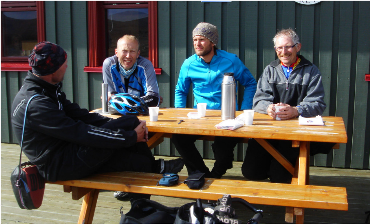
Ein leckerer Kaffee am Campingplatz Laugafell

Nachdem dann die Zelte aufgebaut sind, sitzen wir alle eine Stunde im warmen Badeteich und genießen das Leben. Herrlich! Wir bestätigen uns gegenseitig: Das haben wir uns verdient!