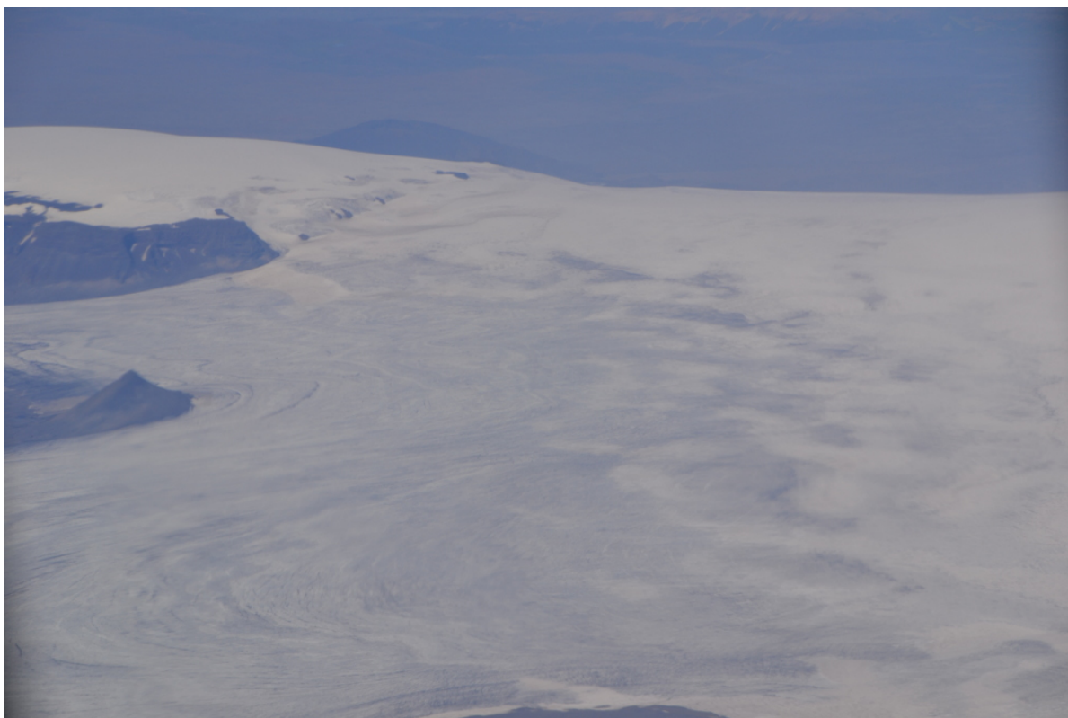
Blick aus dem Flugzeug auf einen Gletscher

Um 8:35 Uhr, also 20 Minuten vor unserem geplanten Abflug, kommt tatsächlich ein Flugzeug angeflogen und landet. Die Passagiere klettern über eine kleine Gangway aus dem Flugzeug und gehen zu Fuß zur Abfertigungshalle. Dann dürfen wir auf dem gleichen Weg einsteigen. Da sich der Gepäckraum hinter der letzten Sitzreihe befindet, können wir zusehen, wie alles Gepäck eingeladen wird. Zum Schluss legen sie erstaunlich behutsam unsere Räder oben drauf. Was will man mehr?