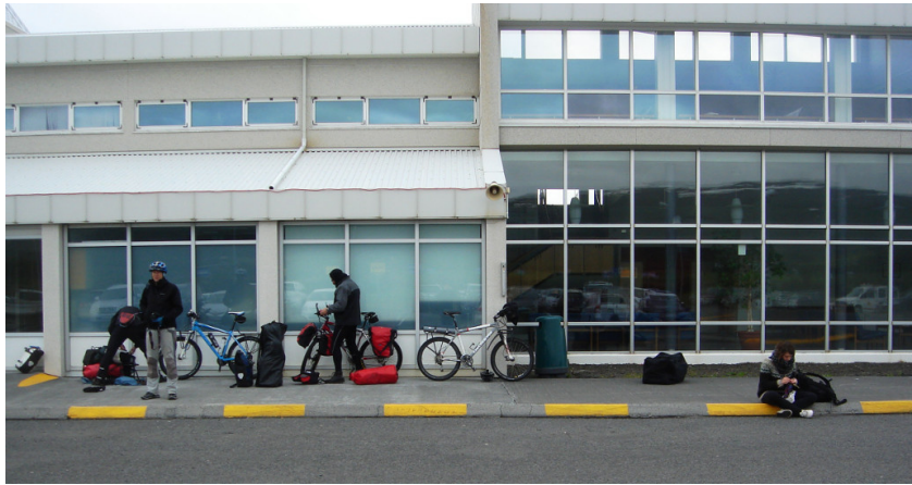
Wir warten vor dem Flughafen

Bis zum Flughafen sind es nur zwei Kilometer, wir sind schnell da. Als wir um 7 Uhr ankommen, ist noch alles abgeschlossen, niemand ist da, auch kein Flugzeug. Das ändert sich auch nicht so bald. Vorsichtshalber schraube ich an meinem Rad schon mal die Pedalen ab und setze sie nach innen. Den Lenker stelle ich quer. Ob das für den Transport reicht, wissen wir nicht, es ist ja keiner da, den man fragen könnte. Erst nach 8 Uhr kommt jemand und schließt auf.