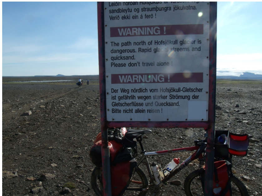
Warnschild, im Hintergrund die Blandá