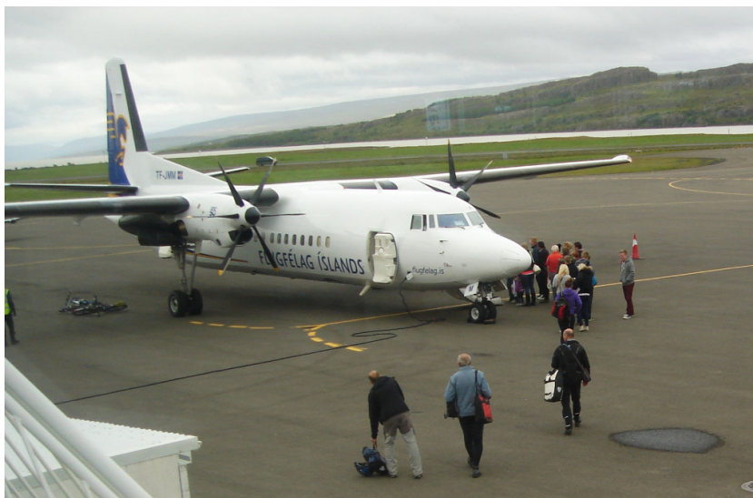
Wir steigen ins Flugzeug

Kilogramm. Ich bin aber sicher, dass der Rest schwerer sein muss. Es ist jedoch nirgendwo eine Waage vorhanden! Wir legen unser Gepäck am Schalter auf einen Gepäckwagen und stellen die Räder daneben an der Wand ab. Das wars. Eine Sicherheitskontrolle gibt