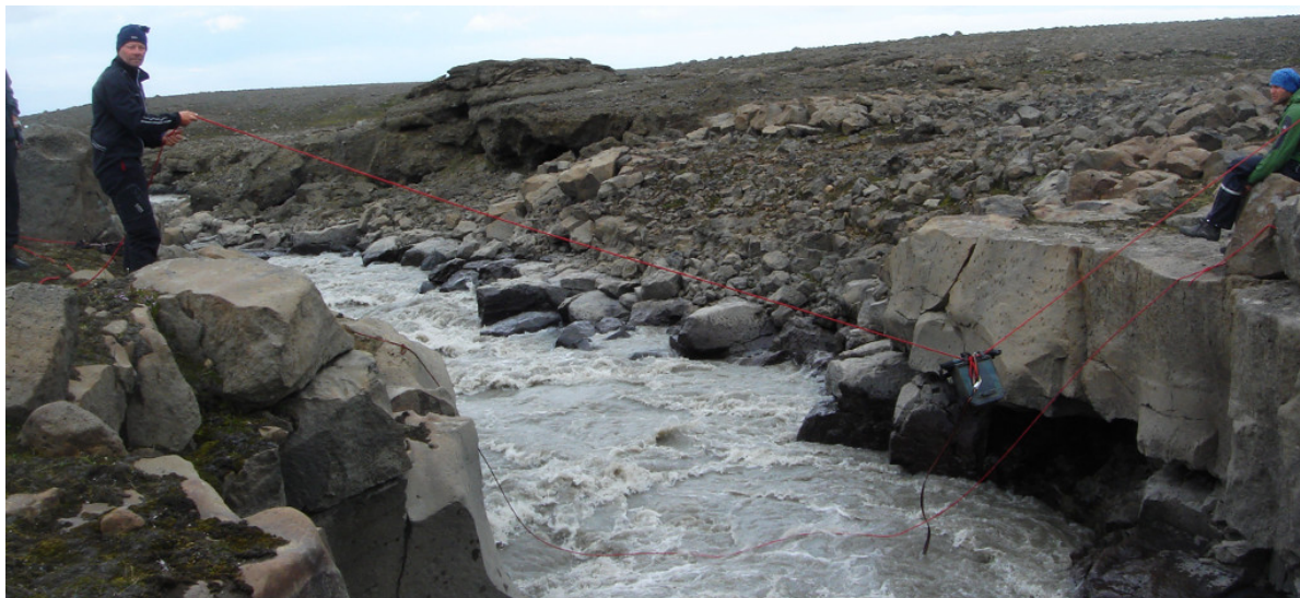
Eine Packtasche wird über die Schlucht gezogen

nächstem Wurf postiere ich mich dicht an der Kante und springe sofort mit einem Fuß auf das Seil, als der Stein aufschlägt. So kann es nicht mehr abrutschen.