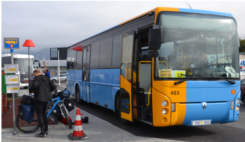
Der Bus soll uns nach Borganes bringen

Während ich noch ein paar Sachen am Rad verstaue, schieben die anderen schon ihre Räder zum Bus. Und dann das: Sie stehen vor der offenen Bustür und der Busfahrer schüttelt den Kopf. Auch ohne dass ich die Konversation habe hören können, weiß ich, wir haben ein Problem! Die vier klären mich auf. Er hat gesagt: „5 Räder passen keinesfalls in den Laderaum des Busses. Nicht mal eins