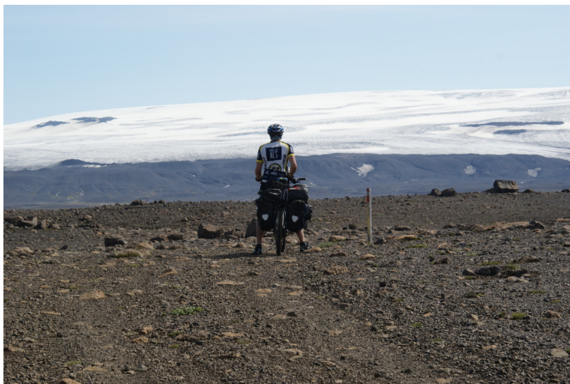
Es geht durch ein Lavafeld

Michael fackelt nicht lange, steigt sofort mit den ersten Packtaschen ins Wasser und trägt sie auf die andere Seite. Christoph sucht sich einen anderen Weg durch die Furt und beginnt ebenfalls mit der Arbeit. Beiden gelingt der Weg zum anderen Ufer. Auch Friedhelm und ich beginnen anschließend mit dem Transport unseres Gepäcks durch die Fluten. Lutz findet den Wasserstand zu hoch. Er sucht verzweifelt nach einer für ihn passierbaren Route durch den Fluss. Als kleinster hat er natürlich die kürzesten Beine, und