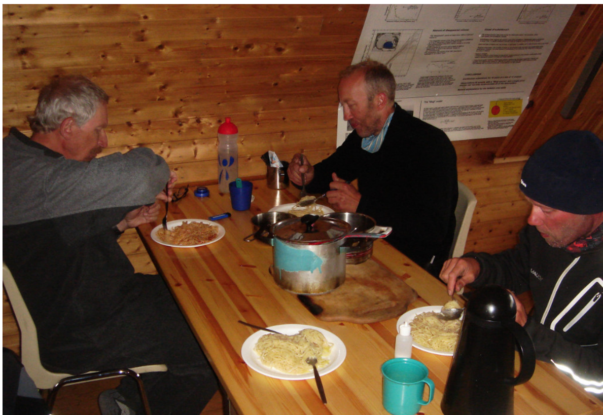
Abendessen im warmen Aufenthaltsraum