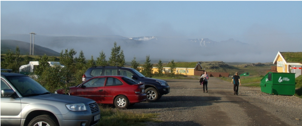
Tiefhängende Wolken am Campingplatz Fossatun

ausschlafen! Ich bin froh, dass ich zur Ruhe komme, denn ich bin doch ziemlich geschafft.