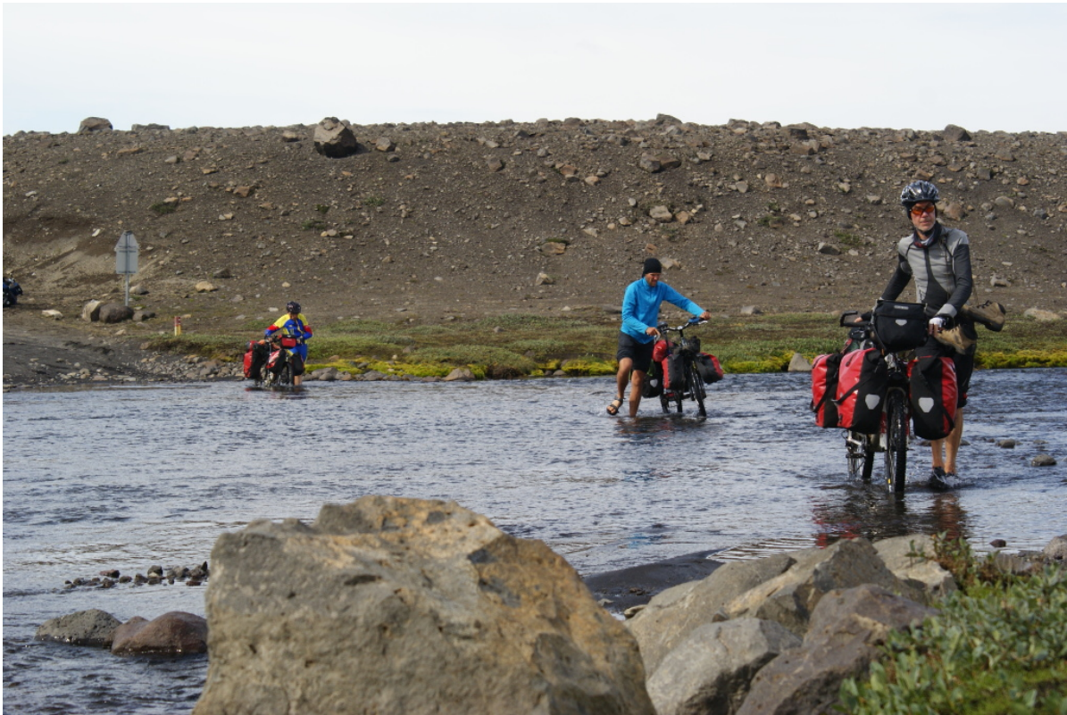
Eine harmlose Furt zum Durchschieben