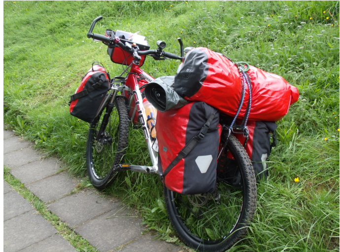
Mein Rad ist startklar

Es sieht so aus, als ob wir unseren Zeitplan umstellen müssen. Damit wir nicht einen ganzen Tag verlieren, wollen wir auch heute noch ein gutes Stück mit unseren Rädern fahren, wenn wir in Borganes angekommen sind. Wir haben dann ja immer noch ein paar Stunden Zeit zum Fahren.