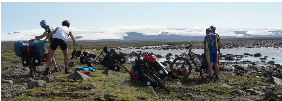
Erst mal alles Gepäck abladen

Schon wenige Meter nach dem Warnschild haben wir die Furt an der Blandá erreicht. Gewaltige Wassermassen strömen da, kein Vergleich zu den Rinnsalen, die wir bisher durchquert haben! Es ist aber eher die starke Strömung, nicht unbedingt die Breite oder die Tiefe der Furt. Eine echte Herausforderung eben, aber wir wollten ja schließlich einen Abenteuerurlaub und keine Kaffeefahrt machen. Wir versuchen uns vorzustellen, wie die Furt wohl am Nachmittag aussieht, wenn der Wasserstand vielleicht noch 20 Zentimeter höher ist. Mir jedenfalls ist das auch so schon anspruchsvoll genug.