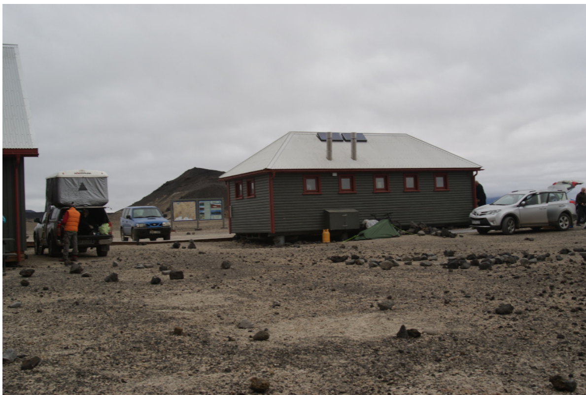
Der Campingplatz an der Askja

tel neu festzuschrauben. Das funktioniert, aber der Sattel hat nun im hinteren Bereich kaum noch Unterstützung. Eine leichte Bodenwelle würde genügen, dass die Sattelnase wieder nach oben zeigt, wenn ich auf dem hinteren Teil des Sattels sitze. Ich schiebe den Sattel also so weit nach vorn, wie es nur geht, um dann nur vorn auf dem Sattel zu sitzen. Dabei stößt die Halterung für die kleine Satteltasche am Sattelkloben an. „Ja, das geht vielleicht auch“, denke ich. Durch diese Halterung stützt sich nun der Sattel auch hinten auf dem Sattelkloben ab. Die Frage ist nur, wie lange dieses filigrane Plastikteil das aushält. Es liegen noch mindestens 150 Kilometer bis Egilsstaðir vor uns.