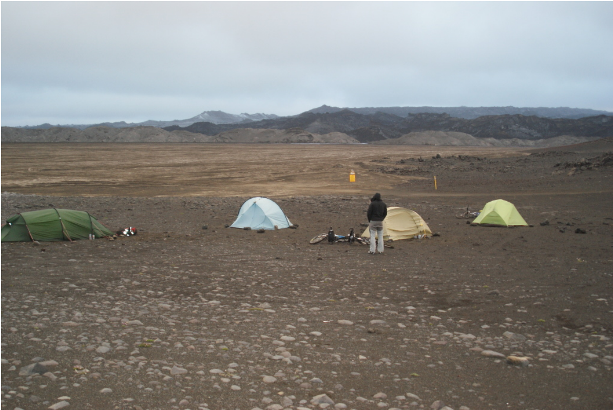
Wir zelten am Schwemmsandfeld, das Wasser ist jetzt weg

Donnerstag, der 1. August Um 4:30 Uhr klingelt der Wecker. Bähh... Das ist verdammt früh, aber es muss sein. Als wir hier vor 5 Jahren waren, konnten wir nicht mehr frühstücken, weil plötzlich schon das Wasser kam. Das soll uns heute nicht passieren. Es ist mit 2 Grad am Morgen immer noch sehr kalt, aber es ist nur teilweise bewölkt. Es weht auch nur wenig Wind. Dadurch fühlt es sich zumindest nicht ganz so kalt an.