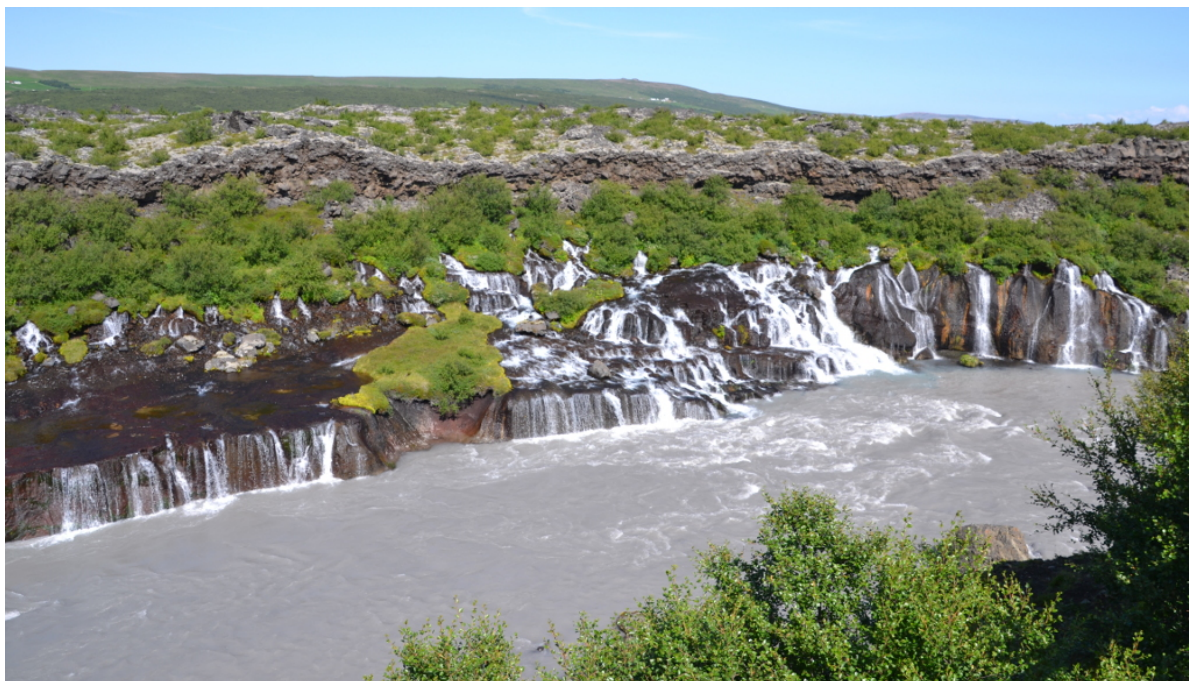
Ein Teil des imposanten Wasserfalls Hraunfossar

Wir fahren weiter und biegen nach etwa 5 Kilometern nach Reykolt, wo wir eine kleine Pause einlegen. Weiter geht es zum riesengroßen Wasserfall Hraunfossar. 2