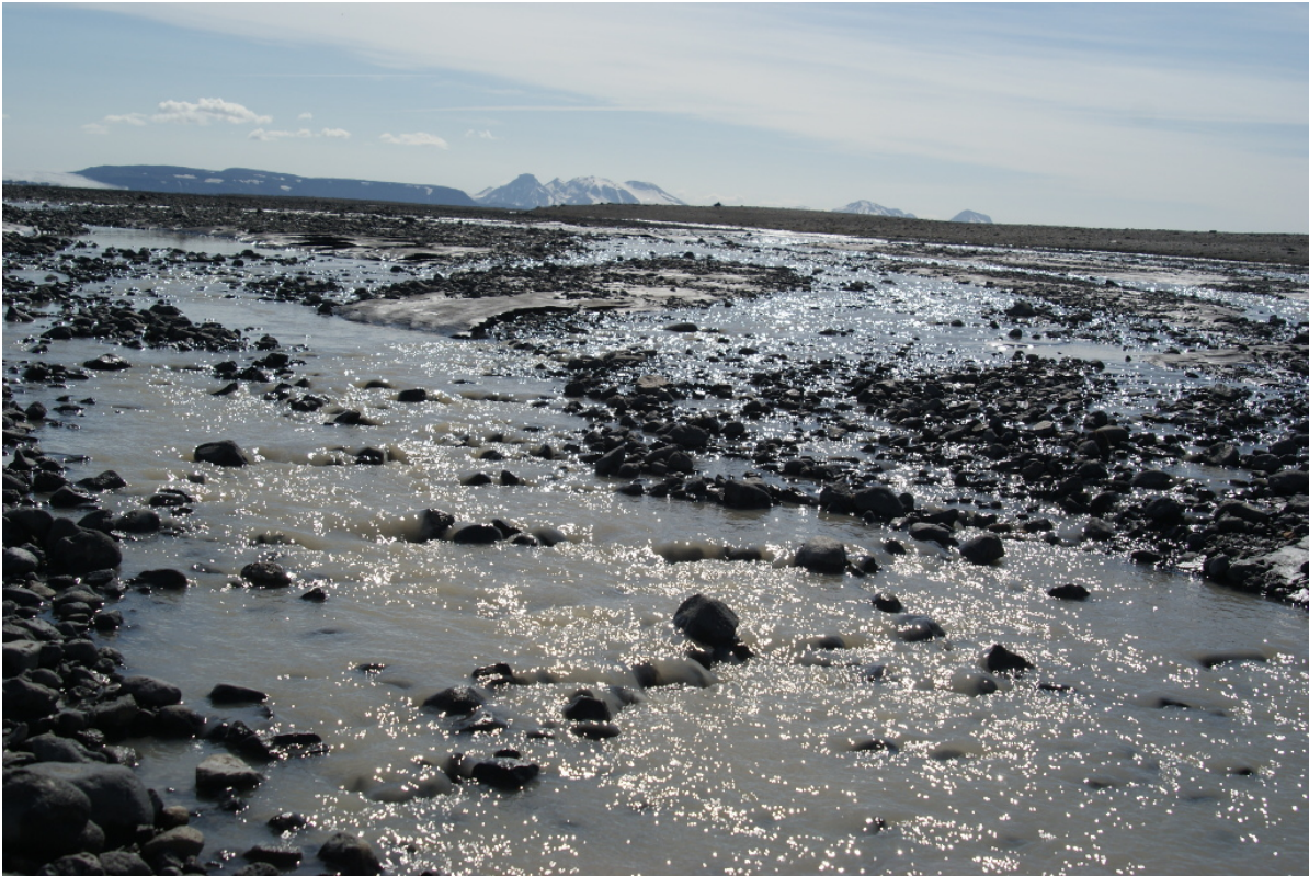
Eine 500 Meter breite Furt

In einem dieser Bereiche quert eine etwa 50 Zentimeter tiefe und 1,5 Meter breite trockene Bachrinne meinen Weg. Natürlich fahre ich da durch und schiebe nicht. Leider habe ich nicht genug Schwung drauf, so dass ich auf der anderen Seite am halben Berg hängen bleibe. Durch die konkave Krümmung der Mulde reichen meine Beine nicht ganz bis an den Boden. Die Folge? Langsam, wie in Zeitlupe, falle ich mit dem Rad um. Nennt man das jetzt einen Sturz? Vermutlich habe ich mich dabei am linken Ellenbogen verletzt, habe das aber nicht gleich gesehen.