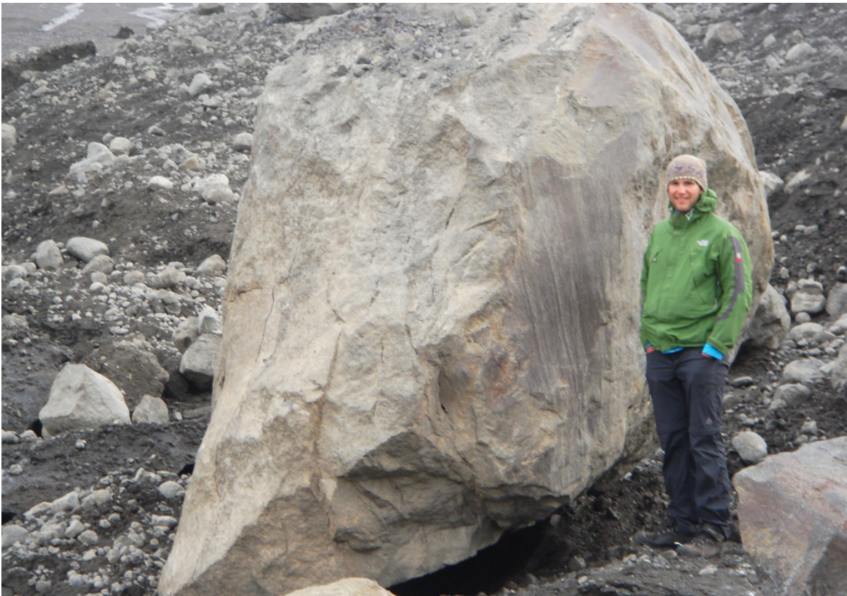
Mächtige Felsbrocken liegen hier herum

Mit 21 Grad ist es immer noch außergewöhnlich warm. Da wir heute nichts weiter tun können, mache ich es mir auf einem großen Felsbrocken bequem und lasse mir die Sonne auf den Pelz scheinen. Ich genieße die Ruhe. Auf der anderen Uferseite steht in etwa 500 Metern entfernt von uns die Schutzhütte Ingólfsskáli. Vor der Hütte erscheint plötzlich ein Auto. Drei oder vier Leute steigen aus und laufen herum. Eine Weile sind sie auch nicht zu sehen, aber dann sind sie wieder da, dann wieder weg. Offenbar schauen sie sich die Gegend an. Schließlich steigen alle ins Auto und fahren los. „Könnte uns dieser Geländewagen nicht durch die Furt bringen?“ überlegen wir. Jetzt fährt er tatsächlich auf die Stelle am anderen Ufer unserer Furt zu und hält dort an. Alle steigen aus. Ich versuche, mich mit dem Fahrer zu unterhalten, was aber sehr schwierig ist, weil das Wasser so laut rauscht. Ich frage ihn, ob er durch die Furt fahren will. „Oh nein, das geht nicht.“ antwortet er. Im Grunde war uns das auch schon klar, denn bei diesem kleinen Geländewagen würde vermutlich das Wasser bis über die Motorhaube spülen. Er empfiehlt uns, bis morgen früh zu warten, weil dann der Wasserstand niedriger ist, oder flussaufwärts zu ziehen, um dort über den Gletscher die andere Flussseite zu erreichen. Letzteres ist sinngemäß ja ohnehin schon unser Plan für morgen. Danach steigen alle wieder ein und fahren weg. Damit sind wir definitiv wieder auf uns allein gestellt.