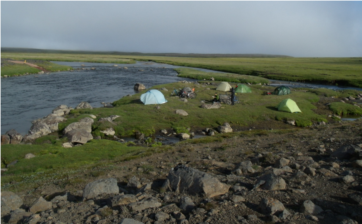
Unser Nachtlager am Fluss

Mittwoch, der 24. Juli Gegen 8:00 Uhr werde ich wach. Langsam kommt die Sonne zum Vorschein. Wir haben schon 14 Grad, es verspricht wieder ein schöner sonniger Tag zu werden. Im Verlauf des Tages geht die Temperatur bis 19 Grad hoch. Das ist ziemlich viel für das Hochland, in dem wir uns befinden. Wir sind nicht weit vom zweitgrößten Gletscher Islands, dem Langjökull entfernt.