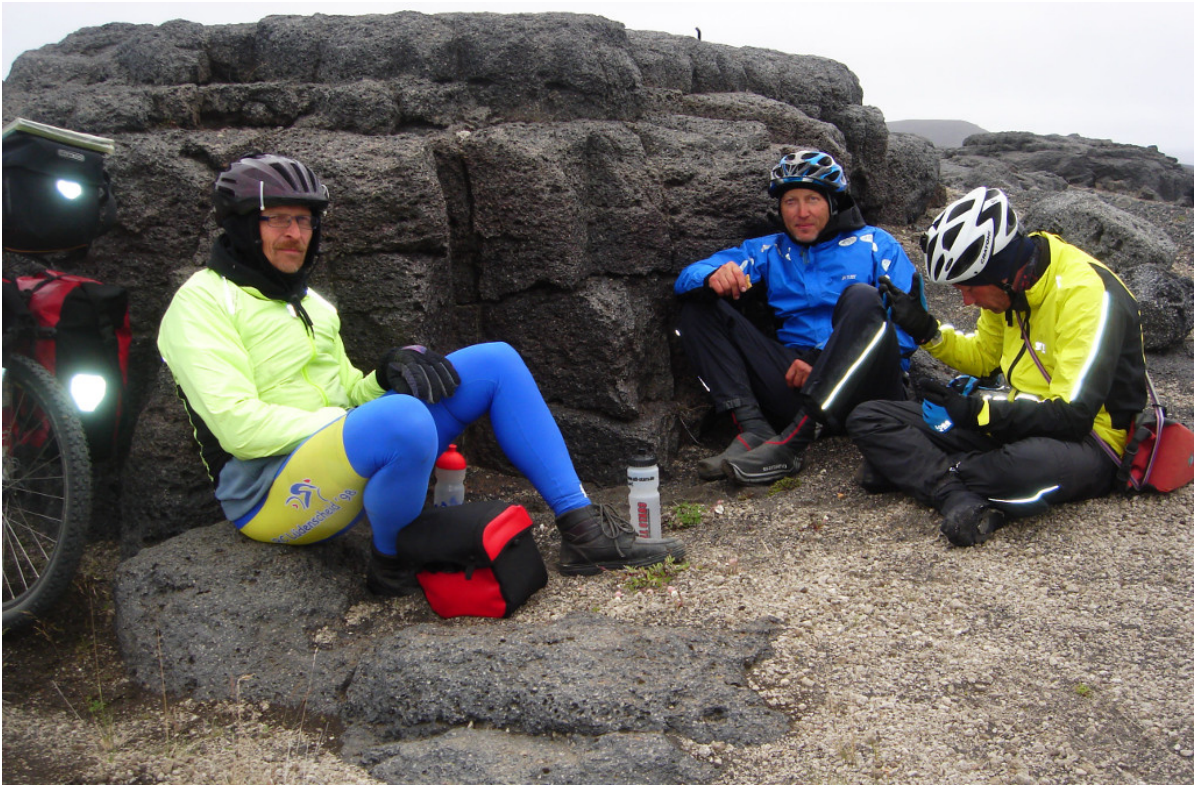
Eine Rast, windgeschützt hinter einer Lavamauer

Plötzlich höre ich wieder dieses üble rubbelnde Geräusch vom Hinterrad, was entsteht, wenn der Gepäckträger auf dem Reifen aufsetzt. Hat die Schienung des Gepäckträgers nicht gehalten, oder ist es ein neuer Bruch? Sorgenvoll halte ich an, um den Gepäckträger zu untersuchen. Glücklicherweise ist nur eine Befestigungsschraube des Trägers herausgefallen. Wieder eine Schraube, die sich losgerüttelt hat. Die ist natürlich weg. In meiner Reserveschraubensammlung findet sich aber etwas passendes und auch eine M6-Mutter, die als Distanzscheibe zweckentfremdet wird. Problem gelöst!