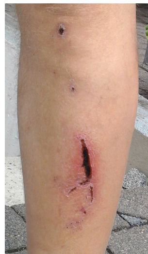
Das Loch im Bein eine Woche später

Wir ziehen meinen Sack mit den Anzihsachen rüber. Es ist schon erstaunlich, dass da kein einziger Tropfen Wasser hineingeraten ist. Ich trockne mich ab und ziehe mir etwas warmes an. Zu meinem großen Erstaunen stelle ich fest, dass die Blutflecken aus der Radhose weg sind. Die kurze Schwimm-Aktion hat die Hose gereinigt? Offenbar ist es tatsächlich so. Allerdings entdecke ich beim Umziehen ein frisches dickes Loch am linken Schienbein. Vermutlich habe ich im Wasser einen Felsblock gestreift. Gespürt habe ich das nicht, warscheinlich hat die Kälte des Wassers narkotisierend gewirkt. Das Loch blutet praktisch nicht, sicherlich ist auch hierfür das kalte Wasser verantwortlich.