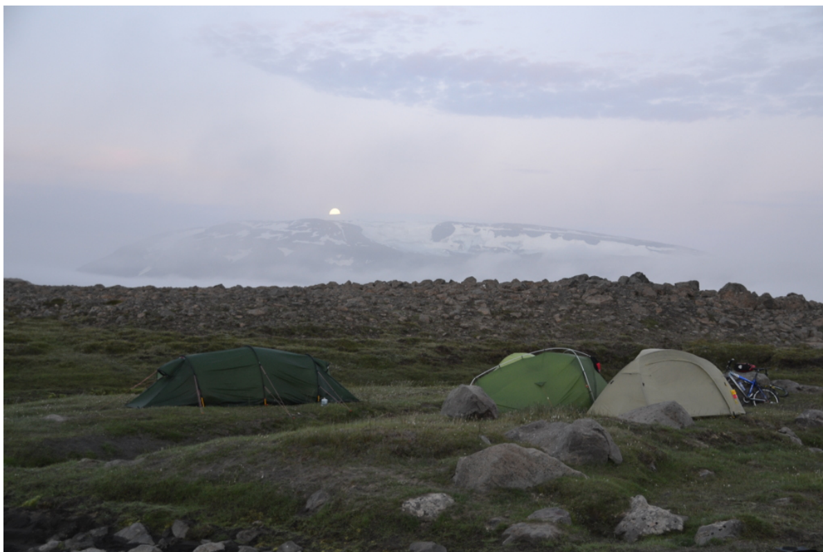
Abend – Die Sonne geht unter

Wir können weiterfahren. Nachdem wir die nächste Furt durchquert haben – es ist eine recht kleine – schlagen wir unsere Zelte für die Nacht auf. Hier haben wir Wasser, und das ist immer wichtig. Das Wasser aus dem Fluss ist zwar recht trüb, aber wenn man es eine Weile stehen lässt, setzen sich die Schwebeteilchen ab und oben im Wasserbehälter hat man sauberes Trinkwasser. Das kann man zum Kochen oder Trinken verwenden. Man muss es nur vorsichtig umschütten. Heute gibt es zum Abendessen Nudeln mit Sauce.