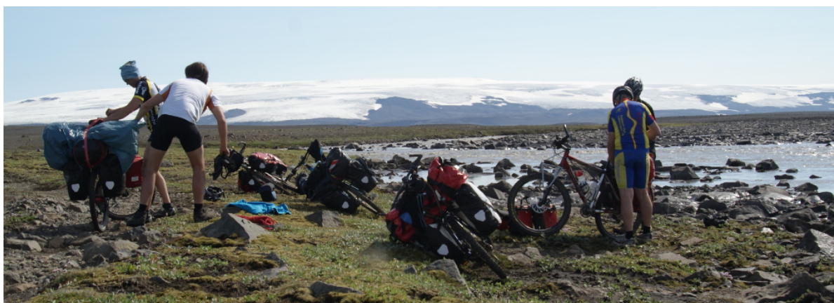
Erst mal alles Gepäck abladen

Schon wenige Meter nach dem Warnschild haben wir die Furt an der Blandá erreicht. Gewaltige Wassermassen strömen da, kein Vergleich zu den Rinnsalen, die wir bisher durchquert haben! Es ist aber eher die starke Strömung, nicht unbedingt die Breite oder die Tiefe der Furt. Eine echte Herausforderung eben, aber wir wollten ja schließlich einen Abenteuerurlaub und keine Kaffeefahrt machen. Wir versuchen uns vorzustellen, wie die Furt wohl am Nachmittag aussieht, wenn der Wasserstand vielleicht noch 20 Zentimeter höher ist. Mir jedenfalls ist das auch so schon anspruchsvoll genug.