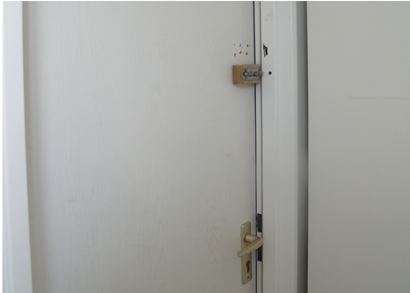
Duschtür mit Riegel außen!

Ich habe zwar heute schon an der ersten Furt mein verschwitztes Trikot ausgewaschen (und auch gleich wieder angezogen), aber hier am Campingplatz kann ich alles richtig, also mit Waschmittel waschen. Diese Gelegenheit nutze ich. Trikot, Hose und Strümpfe geben ordentlich Dreck ab. Ich nutze auch die Dusche des Campingplatzes. Herrlich, sich wieder sauber zu fühlen! Was ich aber nicht verstehe ist der Schließriegel an der Tür