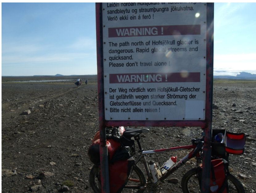
Warnschild, im Hintergrund die Blandá